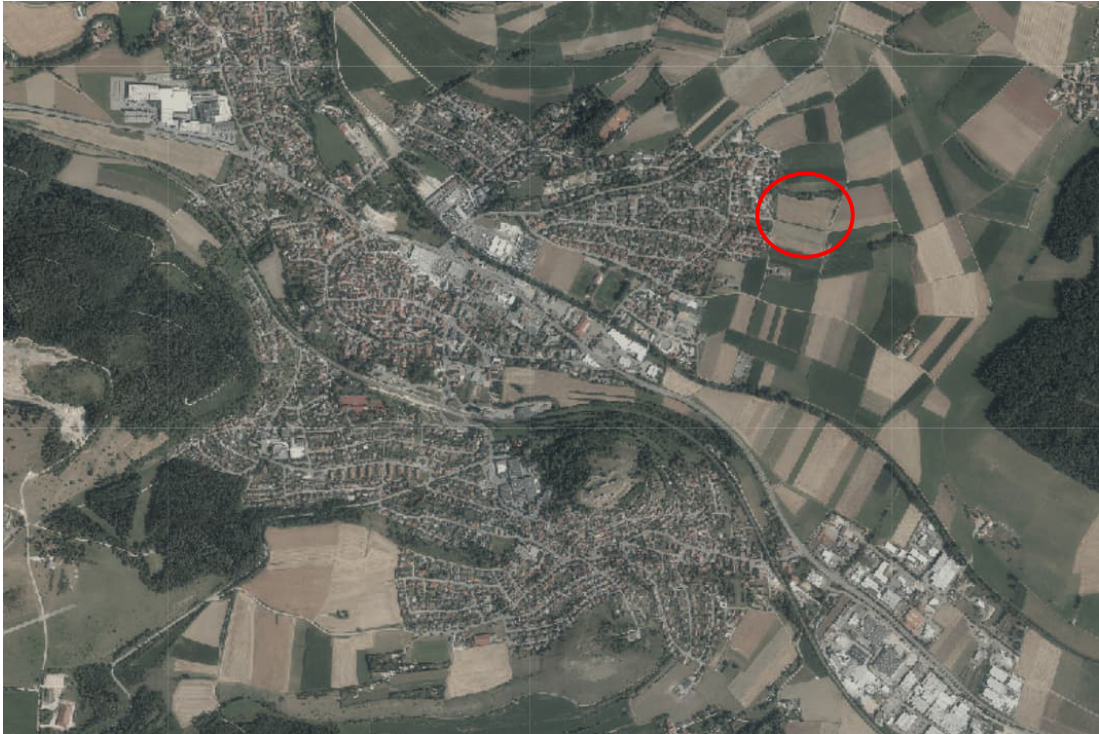
Abb. 1: Lage des Plangebiets „Im Neufeld“ (Quelle: Geoportal Baden-Württemberg – https://www.geoportal-bw.de ), rote Markierung ergänzt durch HPC

In Bopfingen besteht ein anhaltend hoher und dringender Bedarf an Wohnbauflächen durch die ortsansässige Bevölkerung. Sowohl in den Ortsteilen als auch in der Kernstadt Bopfingen besteht eine erhebliche Nachfrage nach Bauland. Bauwillige ortsansässige Bürger sind bestrebt in Bopfingen zu bleiben und hier ihr Eigenheim zu errichten. Um den aktuellen und zukünftigen Interessenten geeignete Bauplätze anbieten zu können, soll östlich vom Wohngebiet „Kirchheimer Berge II“ ein neues Wohngebiet entwickelt werden.