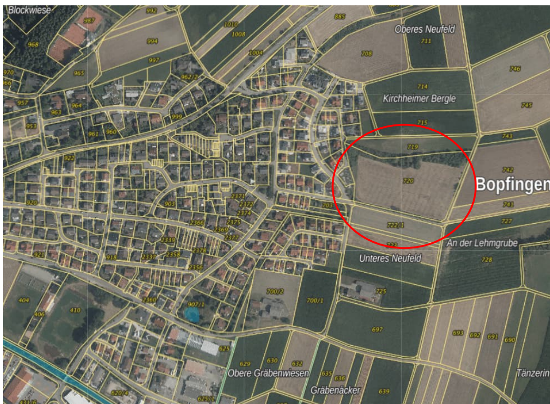
Abb. 4: Lage des Plangebiets „Im Neufeld“ mit Flurgrenzen und -nummern, rote Markierung ergänzt durch HPC

Das Planungsgebiet wird im Norden durch ein Feldgehölz und einer Obstbaumbrache, im Osten und Süden durch landwirtschaftlich genutzte Flächen und Feldhecken begrenzt. Nach Westen grenzt das Baugebiet an das bestehende Wohngebiet „Kirchheimer Berge II“ an.